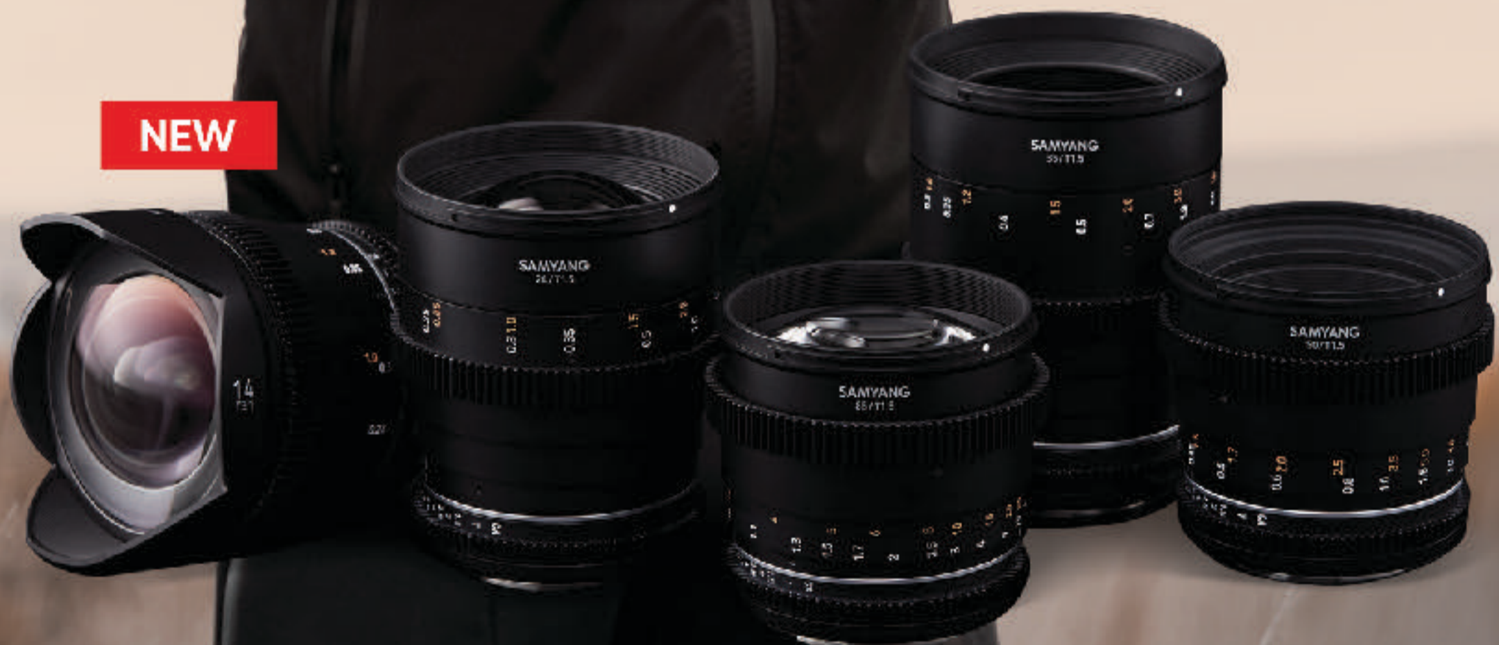
14mm T3.1 MK2