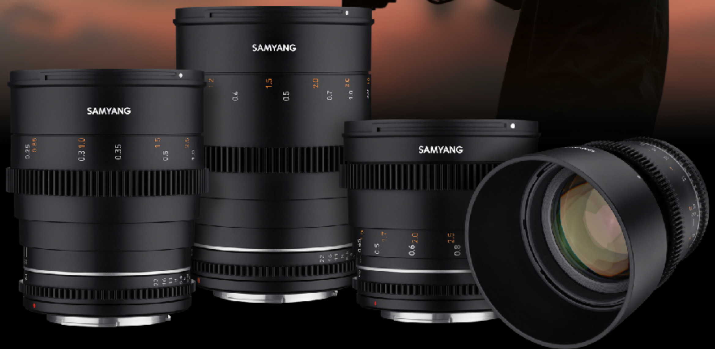
24mm T1.5 MK2