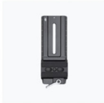
Piastra a sgancio rapido (Arca- Swiss/Manfrotto) × 1