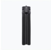
Manico/Treppiede estensibile (Plastica) × 1