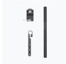
Kit di montaggio per asta del motore di messa a fuoco × 1