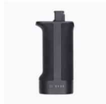
Impugnatura BG21 × 1