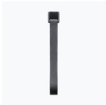
Fascetta di serraggio per obiettivo × 1