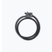
Cinghia dentata per messa a fuoco × 1