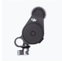
Motore di messa a fuoco (2022) × 1