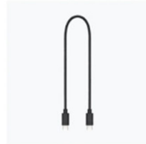
Cavo di controllo multicamera (USB-C, 30 cm) × 2