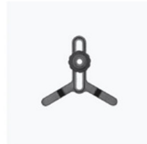
Supporto per fissaggio delle lenti × 1