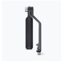
Impugnatura a maniglia × 1