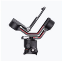
Stabilizzatore × 1