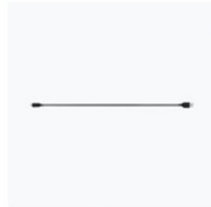
Cavo di ricarica USB-C (40 cm) × 1