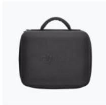
Custodia da trasporto × 1